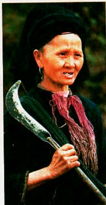
LA GUADAÑA. Ella es de la feroz minoría china H'mong Lan Ten.

por el Transiberiano. Desde hace 14 años trabajo para un operador turístico en Francia, a cargo de la producción de itinerarios de aventura. Pega de escritorio, pero nunca dejo de guiar grupos, en especial si vienen hacia Chile.